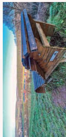
Blick vom 725er

Tolle Ausblicke auf Philippstal und ins Werratal hinein, interessante Info tafeln und eine Relaxliege erwarten euch bei einer Wanderung auf dem „725er“. Der Rundwanderweg „725er“ erstreckt sich auf 7,25km und 142 Höhenmetern oberhalb des Philippsthaler Ortsteils Röhrihof. Der Weg dient als bleibende Erinnerung an das 725-jährige Dorfjubiläum im Jahr 2015.