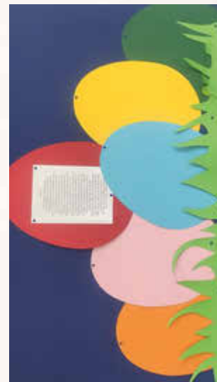
Ostern im Heimatmuseum Friedewald

Vom 07.03. bis zum 13.04. könnt ihr die Sonderausstellung „Ostern“ im Heimatmuseum Friedewald besuchen. Entdeckt alte und vertraute Traditionen, Rezeptideen für das österliche Backen, Kochen und Färben sowie Osterrätsel für kleine und große Entdecker. Infos zu den Öffnungszeiten des Museums findet ihr unter: https://www.museum-friedewald.de/