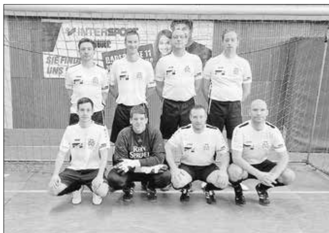
Mannschaft der SG Hohenroda

Der Hünfelder SV verteidigt seinen Titel beim 39. AH-CUP