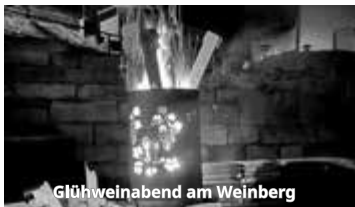
Glühweinabend am Weinberg

Betriebsruhe bei Ungefrorens Höfchen vom 05.01.-20.01.26