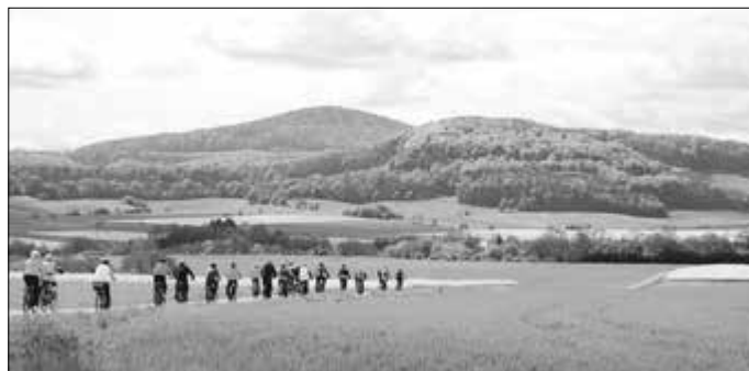
Fahrt in den Frühling: Mit dem traditionellen Anradeln beginnt auch in der Kuppenrhön-Werratal-Region offiziell die Radsaison. Start und Ziel ist am Hugenottenplatz in Gethsemane.