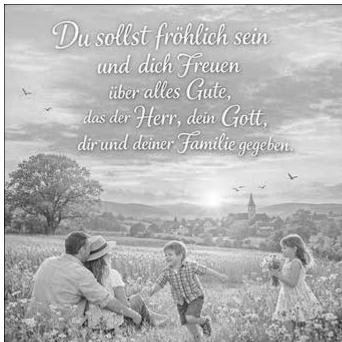
Eine gesegnete Woche wünscht LKG-Werratal

Aktuell | Erfolgreich | Informativ Ihr Mitteilungsblatt!